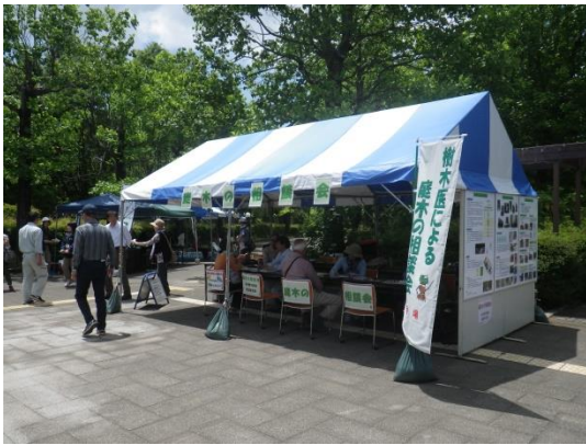
庭木の相談会 相談状況