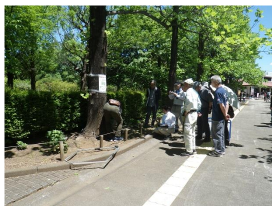
精密診断デモンストレーション状況