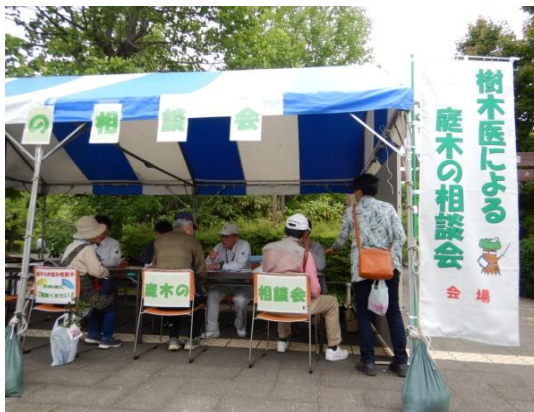
庭木の相談会 相談状況